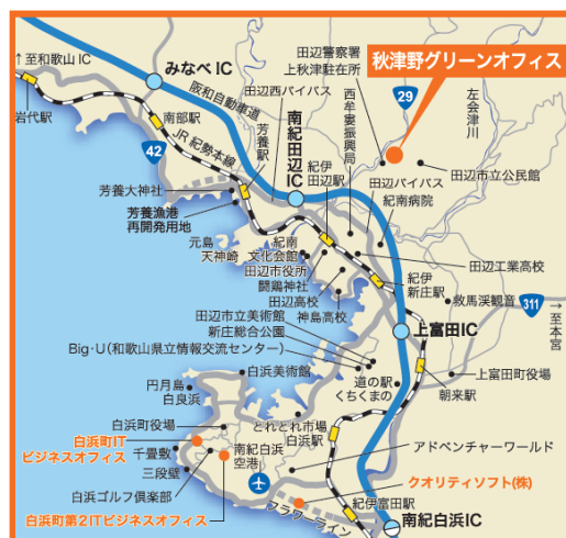
(所在地：和歌山県田辺市上秋津 4558-2)